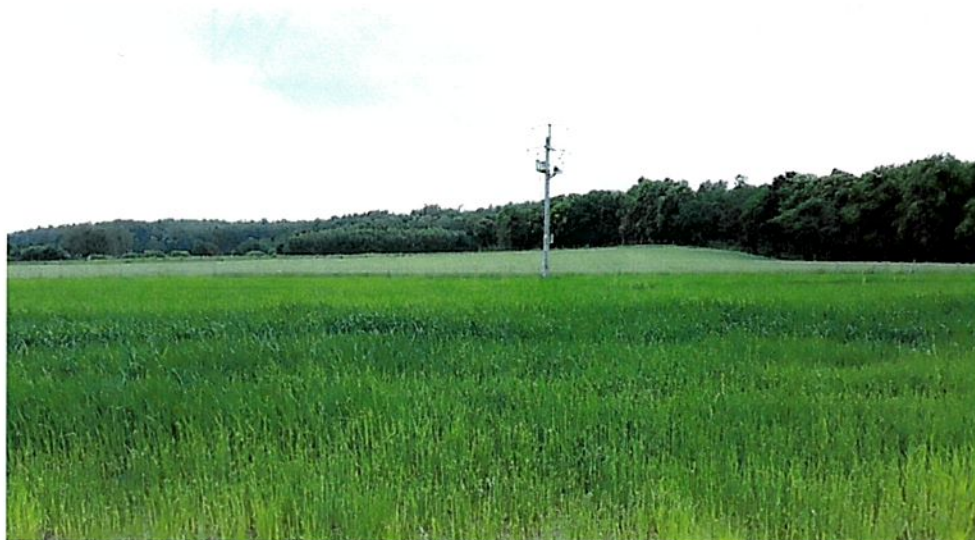
Rysunek 1 Sposób użytkowania gruntu – stadium wzrostowe roślin zbożowych